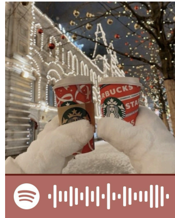
playlist della settimana